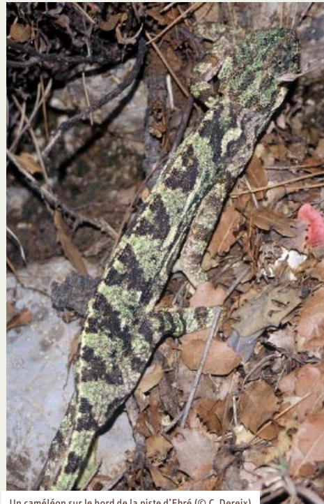
Un caméléon sur le bord de la piste d'Ebré

Notre projet s'est donc bâti sur ce principe d'une gestion durable de qualité des forêts. On ne protège pas la forêt en la mettant sous cloche. Je ne suis pas sûr que la forêt vaille d'être sacralisée ; en tout cas, si on veut la sacraliser, que ce soit non pas seulement pour ce qu'elle est, mais pour ce qu'elle apporte. Et les bienfaits de la forêt sont nombreux : le bois que je citais à l'instant ; la faune dans toute sa diversité, espèces gibier -mais la chasse est interdite, n'est-ce pas ?-, petits ou plus gros mammifères, oiseaux, insectes, ce caméléon rencontré sur le versant nord du Jabal Moussa ou ces loups qui y ont été récemment filmés ; la flore, elle aussi sous toutes ses formes, et les inventaires récents ont montré qu'elle était particulièrement riche sur le Jabal Moussa avec nombre d'espèces rares et protégées au niveau mondial ; la biodiversité donc qui réunit faune, flore, milieux écologiques et qui constitue cette si importante « assurance-vie de la planète » ; et les paysages, ces merveilleux paysages du Liban que l'on retrouve sur tant de cartes postales ou dépliants touristiques qui invitent à la promenade, à la randonnée ou, tout simplement, à la contemplation.