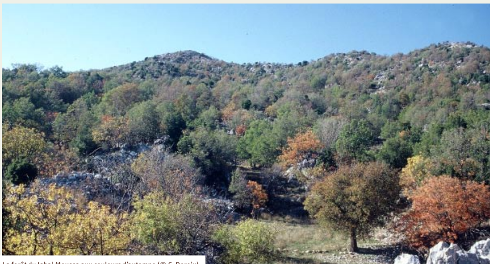
La forêt du Jabal Moussa aux couleurs d'automne