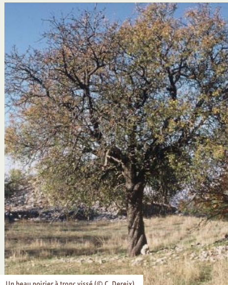
Un beau poirier à tronc vissé