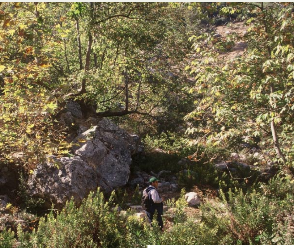
Dans les platanes du torrent Ain el Aouainat (altitude 870m)

Décrire la forêt, identifier ce qu'elle peut donner, écouter les hommes et comprendre ce qu'ils souhaitent : de cette confrontation va s'élaborer un plan de gestion durable de la forêt pour garantir la pérennité de la forêt, l'améliorer, la renforcer, l'équilibrer, assurer sa régénération continue et régulière et répondre le mieux possible, et demain plus qu'aujourd'hui, aux souhaits des habitants. Une forêt pour aujourd'hui, mais une forêt plus belle et plus forte, plus généreuse encore pour demain.