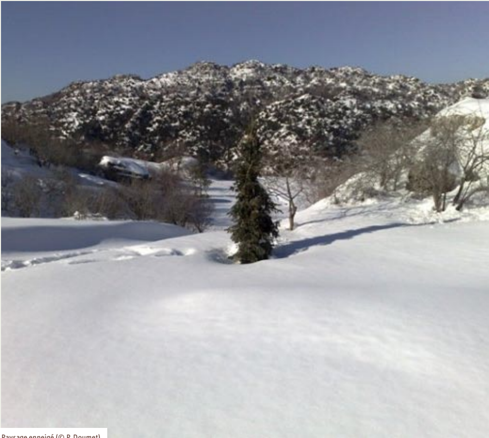
Paysage enneigé

La fête de St. Siméon, célébrée le 1er Septembre, prend, elle, une envergure particulière; elle est l'occasion d'un triduum de festivités allant du dîner-soirée-dansante sous le chêne millénaire de l'église dont le tronc nécessite les bras ouverts de quatre hommes pour le contourner ; à la kermesse, aux récitals musicaux, aux séances du célèbre « Zajal » sorte de duel verbal en langage libanais où des poètes populaires se livrent à des joutes oratoires animées de défis... ou de simples échanges d'amabilités... sans oublier les étalages et kiosques des vendeurs saisonniers ambulants..., tout ceci sous les carillons exceptionnels d'une cloche devenue célèbre dont les sons se font entendre, bien au loin, parmi monts et vallées.