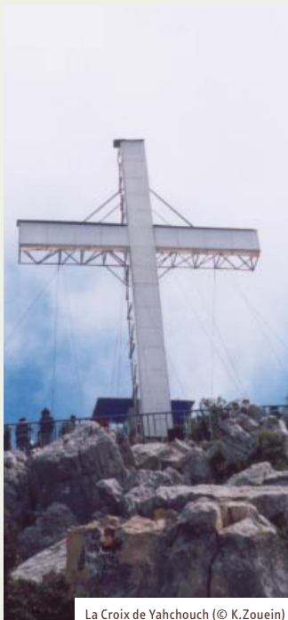
La Croix de Yahchouch

à dos d'homme, de Yahchouch jusqu'au sommet de la montagne, les jeunes ayant tenu à en garantir personnellement le transport malgré l'opportunité qui leur en était offerte gracieusement, par un hélicoptère de l'armée libanaise. Cette croix, une fois installée et illuminée à longueur de nuits, finit par parfaire le tableau.